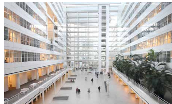
Het atrium van het stadhuis

C Einde la, Lange Poten . Op Plein schuin oversteken en Lange Houtstraat in. Op kruising ra, Korte Voorhout . Links de Amerikaanse ambassade (Breuer, 1959; verhuist in 2017). Over brug en ra naar het station. Winkelcentrum Babylon (1978, links van station) is in 2011 grondig vernieuwd met onder meer 100 en 140 m hoge torens.