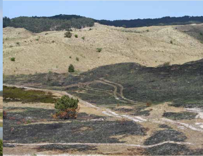
De Schoorlse Duinen na de brand van voorjaar 2011