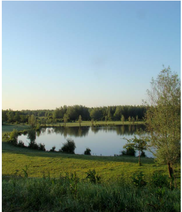
Een van de vele plassen in De Stille Kern

3 De Horsterberg geeft sinds 2002 een prachtige kijk op De Stille Kern. Een gebied