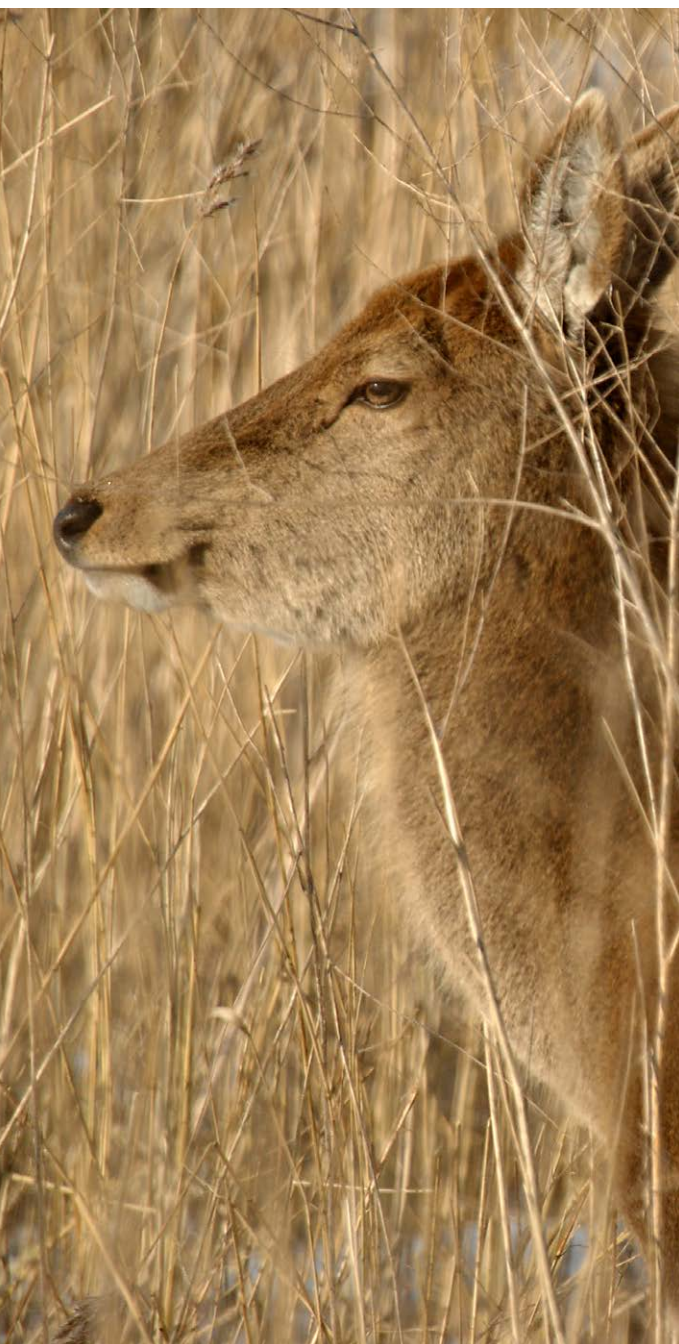
Op open bosweiden grazen reeën

met natuurlijke graslanden, waterpartijen, omzoomd door struiken en bos. Hoewel dit deel van het 900 ha grote natuurgebied pas in 1994 werd ingericht zien we nu een landschap dat hier veel langer geleden van nature had kunnen ontstaan. Dat heeft veel te maken met de enorme groeikracht van de vette zeeklei. De bomen en struiken groeien hier in een