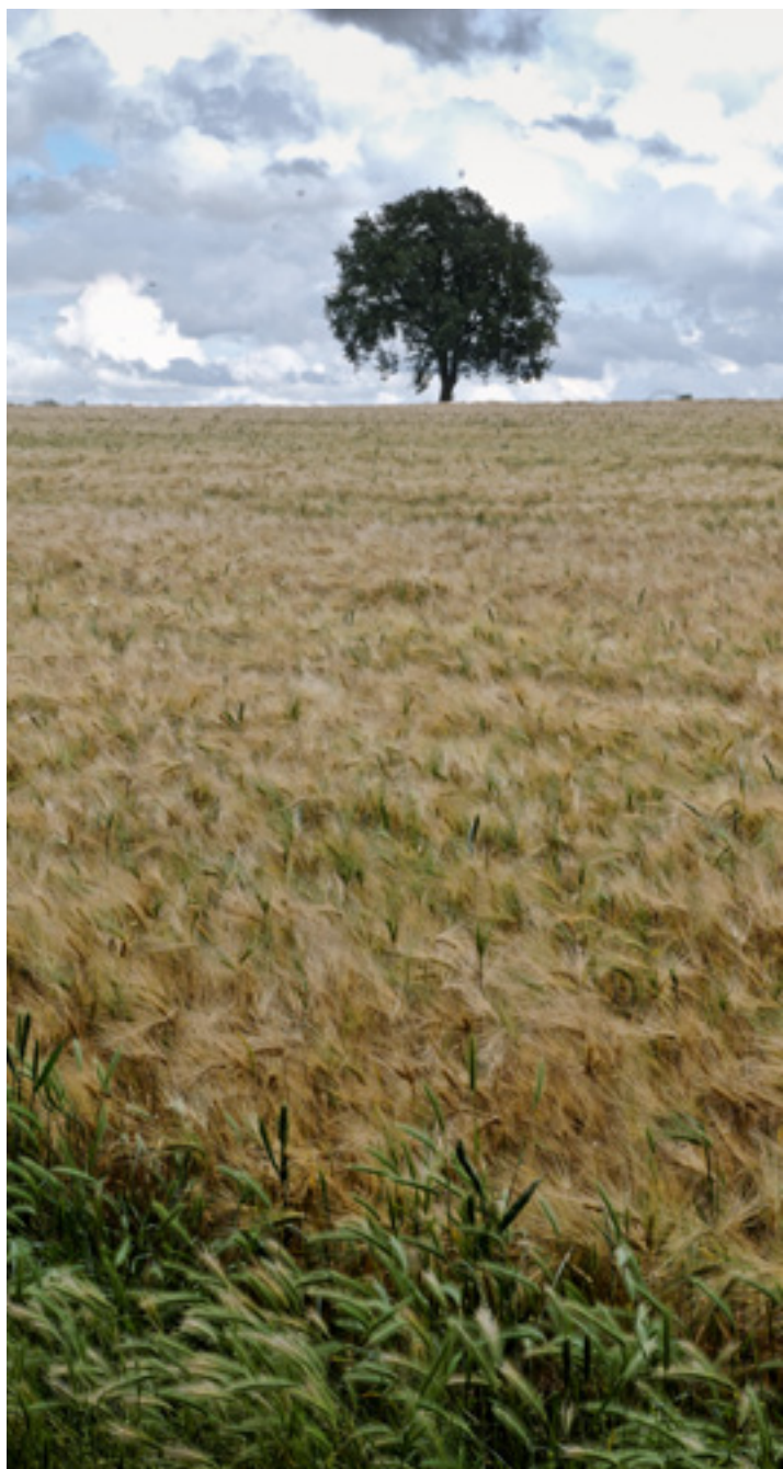
Graanvelden op het Plateau van Margraten

4 Voorbij de schaapskooi ligt aan de linkerhand een kalkgrasland dat vol staat met orchideeën. Deze kalkgraslanden zijn vanwege hun zeldzaamheid en kwetsbaarheid niet vrij toegankelijk,