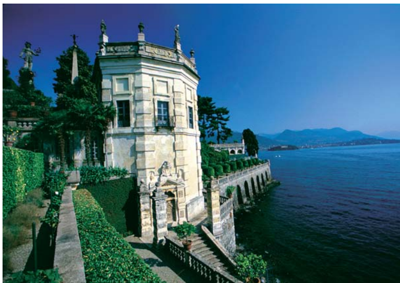
Isola Bella in het Lago Maggiore (PS)