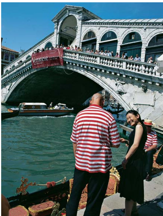
De Rialtobrug in Venetië (LS)

De A4 Milaan – Verona is sinds 1 oktober 2007 verbreed. Tussen Milaan en Bergamo heeft de A4 in beide richtingen vier rijstroken over een lengte van 34 kilometer. De A4 is een van de drukste Italiaanse wegen.