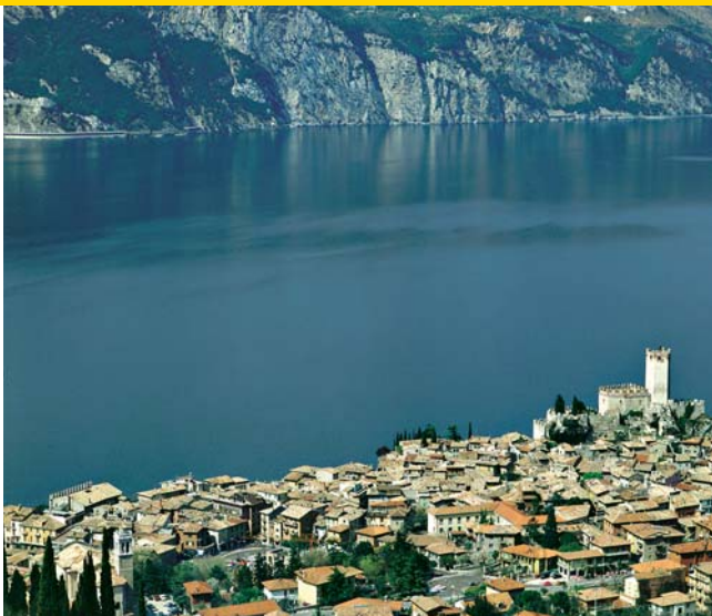
Malcesina aan het Gardameer (PP)

Als u naar Sicilië reist en in het weekeinde aankomt, adviseren wij u voldoende contant geld mee te nemen, aangezien de pinautomaten dan vaak leeg zijn.