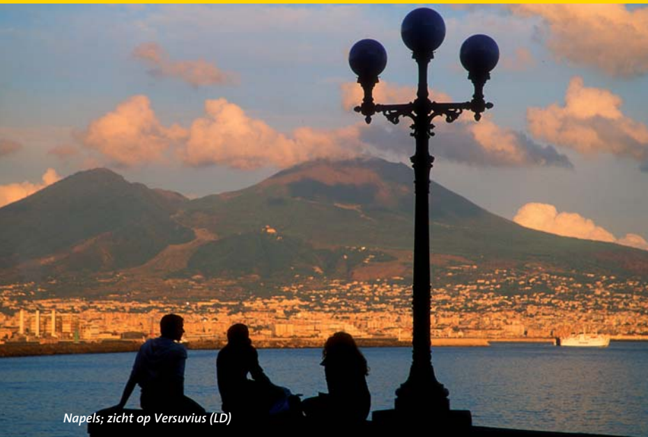
Napels; zicht op Versuvius (LD)