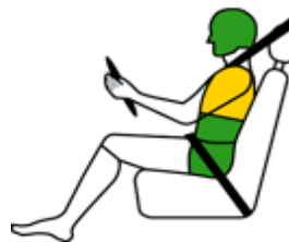
Bestuurder zijdelingse botsing

■ Goed ■ Voldoende ■ Marginaal ■ Zwak ■ Slecht