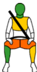
Passagier frontale botsing