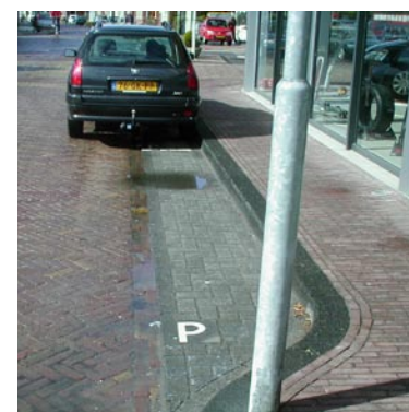
Dat is nog eens half werk.