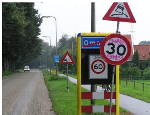
Gas geven of remmen? In Ommen is het onduidelijk. Snapt u het?