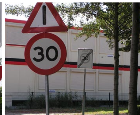
Werkverschaffing: plaats een overbodige paal.