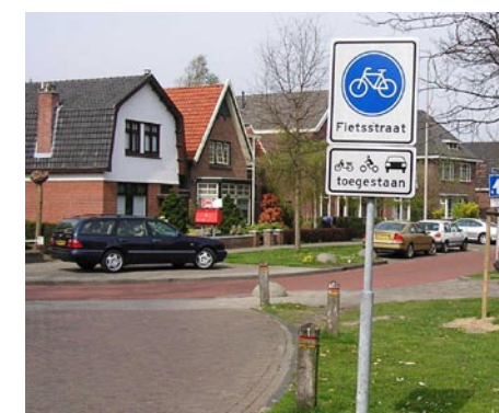
Fietsstraat: voor fietsers én alle andere voertuigen.