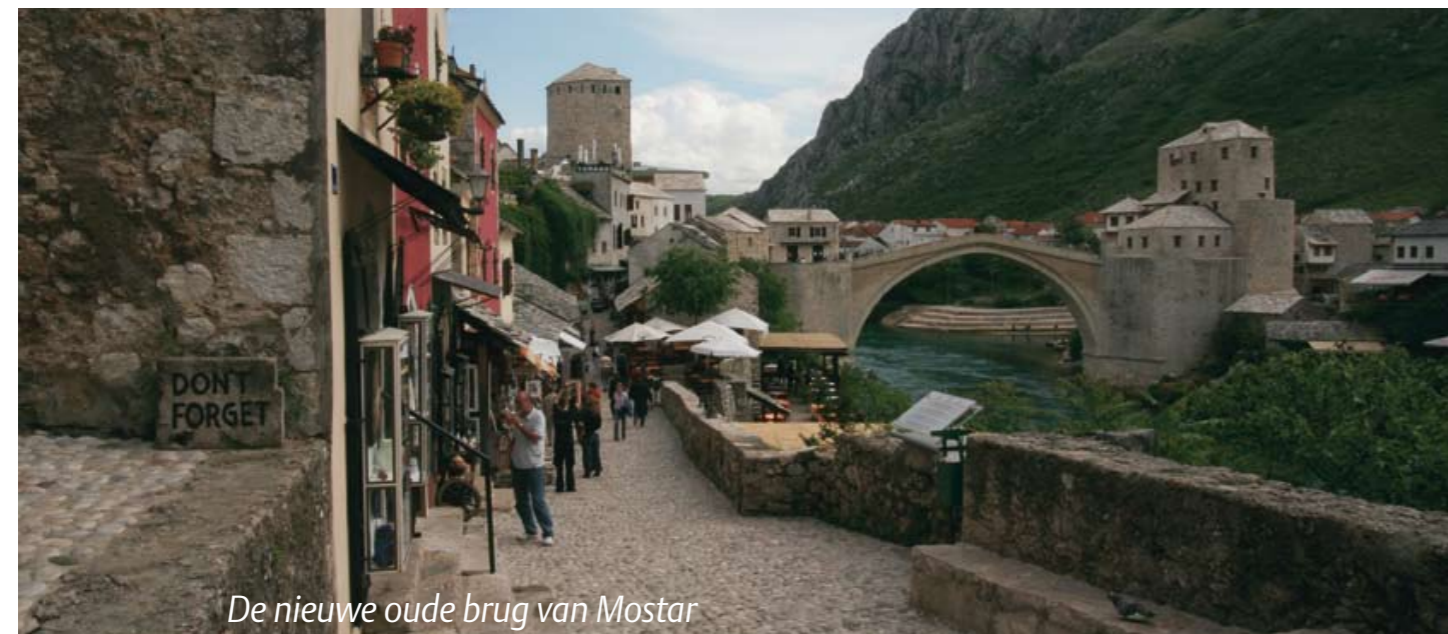
De nieuwe oude brug van Mostar

meer te vinden. Dat is geen gevolg van de Joegoslavische burgeroorlog, maar van de aardbeving die in de 17 de eeuw bijna de complete binnenstad verwoestte. Aan het eind van de middag gaan we op zoek naar een het mooiste terras van Dubrovnik: Café Buza, balanceerend op de steile rotsen tussen de stadsmuren en de zee. Hier kunnen we eindeloos blijven zitten. De milde zon in het gezicht en de zeebries in het haar. Terwijl de vissersbootjes langs varen, bestellen we twee glazen ijskoude prošek , heerlijke witte wijn van het nabijge schiereiland Pelješak. Nog even. Dan zakt de zon achter de verre heuvelrug en beleeft Dubrovnik haar magische moment. Vandaag gaan we niet naar de Stradun om het mee te maken. We lopen naar ons appartement bij de kathedraal, zetten de ramen wijd open en laten het gouden licht binnen stromen. ☉