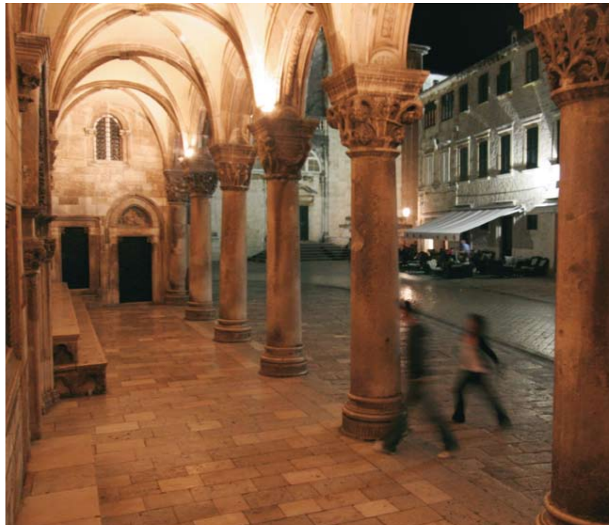
Rechtsboven: de oude binnenstad is een wirwar van stegen en straatjes. Uiterst rechts: op het terras van Café Buza, 'hangend' boven zee, vergeet je de tijd. Rechts: het Paleis van de Rectors.

Met een beetje geluk kun je vanaf het stadsstrand de maan vanuit zee zien opkomen. Kan geen kaarsje tegenop.