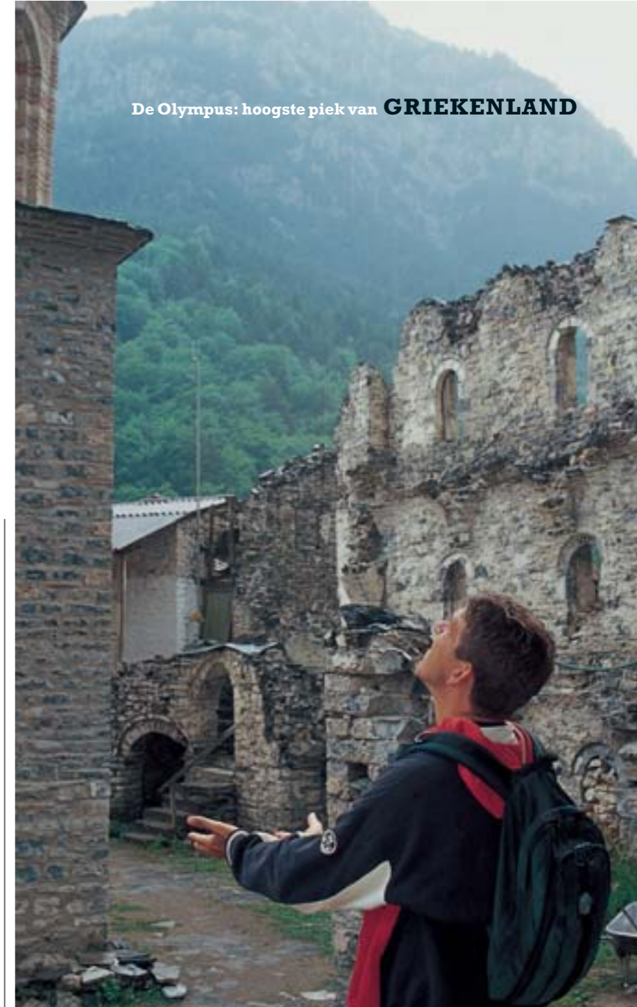
Boven: wachten in het klooster van Agios Dionisos totdat de zware onweersbui die Zeus over ons uitstort, voorbij is getrokken. Linksonder: 'Yes please, very nice fur coats, good price!' Rechts onder: in godenstad Dion liggen overal resten van Romeinse mozaïeken.

De Olympus: hoogste piek van GRIEKENLAND