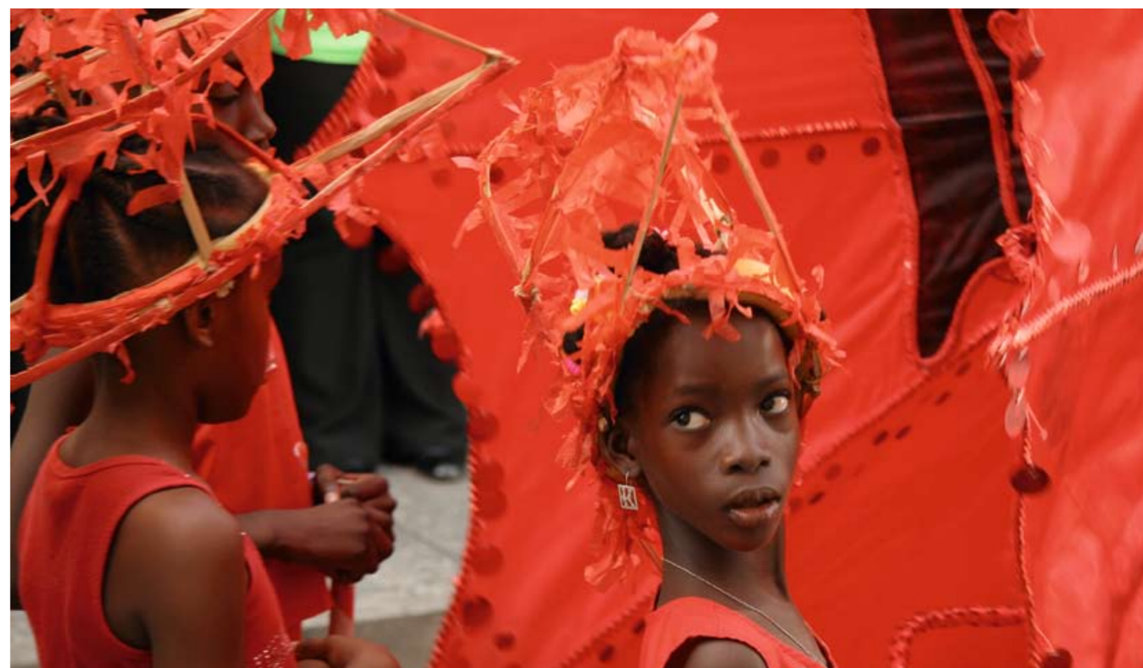
Foto onder: feesten zit Tobagonians in het bloed, zoals hier bij een voorfeest van het jaarlijkse Tobago Heritage Festival.