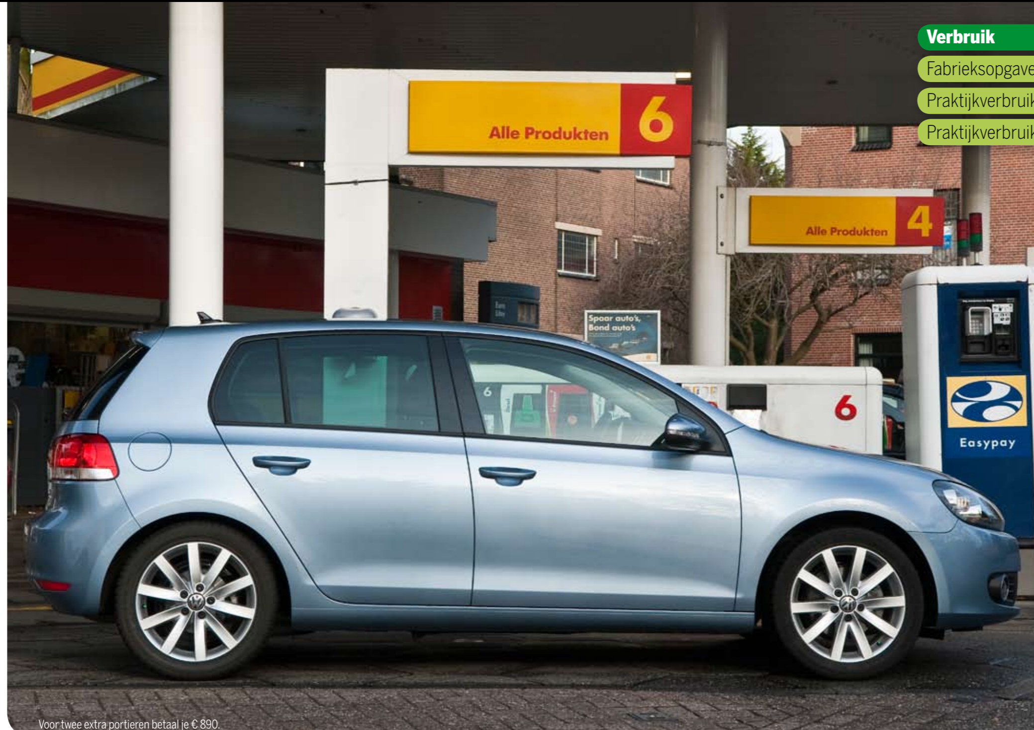
Voor twee extra portieren betaal je € 890.

De zesde generatie Golf rijdt niet veel anders dan de vijfde. Beschouw dat maar als een compliment, want ook op de voorganger was niet veel aan te merken. Je stapt makkelijk in, hebt voldoende ruimte voor hoofd en benen (zowel voor- als ach-