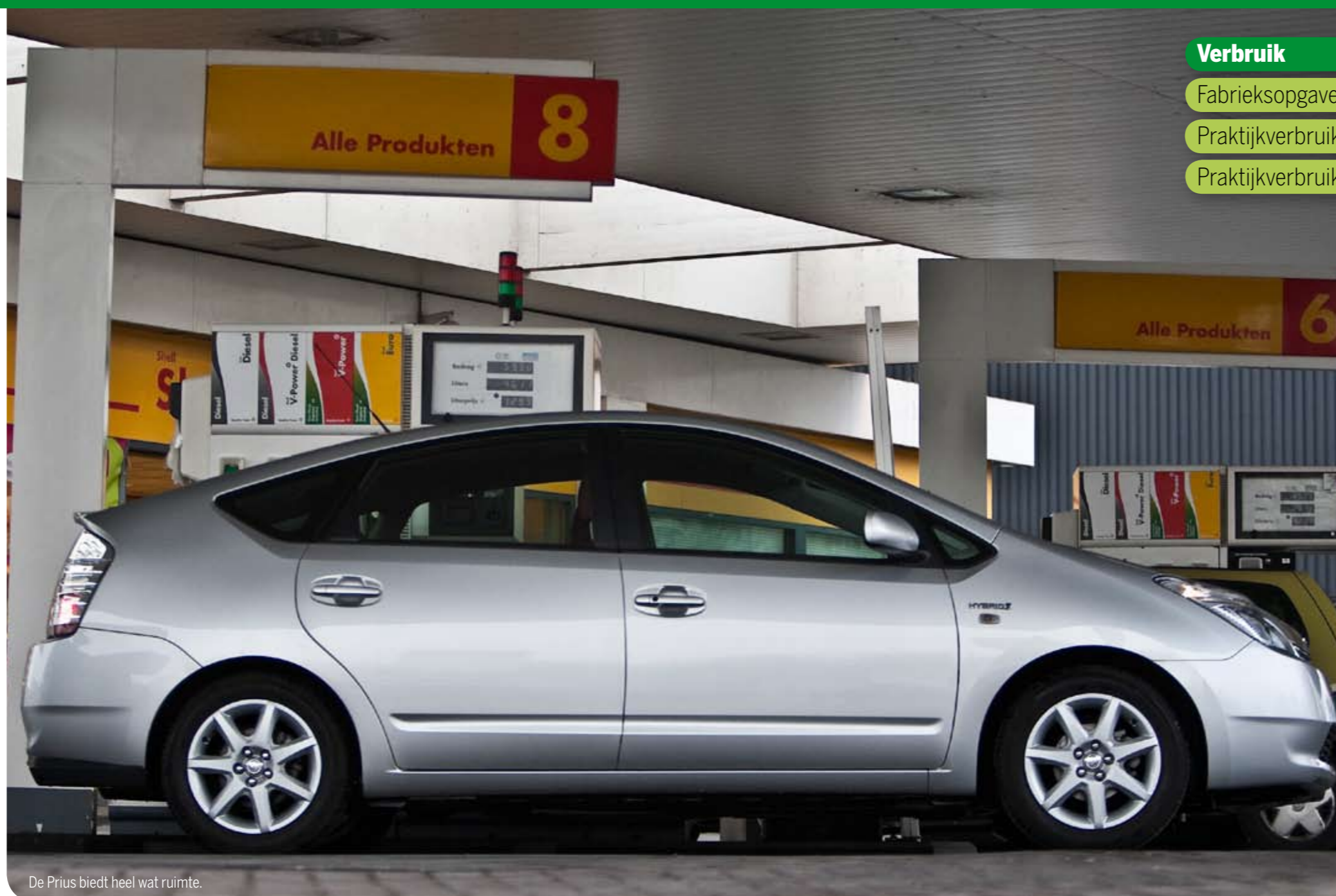
De Prius biedt heel wat ruimte.

Je hebt al een Prius voor € 24.990. Dan spreken we over de Comfort, die behoorlijk goed is uitgerust. Voor € 3760 meer heb je de Tech, met onder meer DVD-navigatie en intelligent parkeersysteem. En de Business kost € 4160 meer dan de basisversie, met eveneens DVD-navigatie en een audiosysteem met cd-wisselaar en negen speakers. Vanwege zijn lage uitstoot (A-label) is de Prius vrijgesteld van BPM, betaal je vanaf 1 april nog maar de helft aan motorrijtuigenbelasting en vergt hij slechts 14% fiscale bijtelling als auto van de zaak. Geen wonder dat de Prius onder lease-rijders populair is.