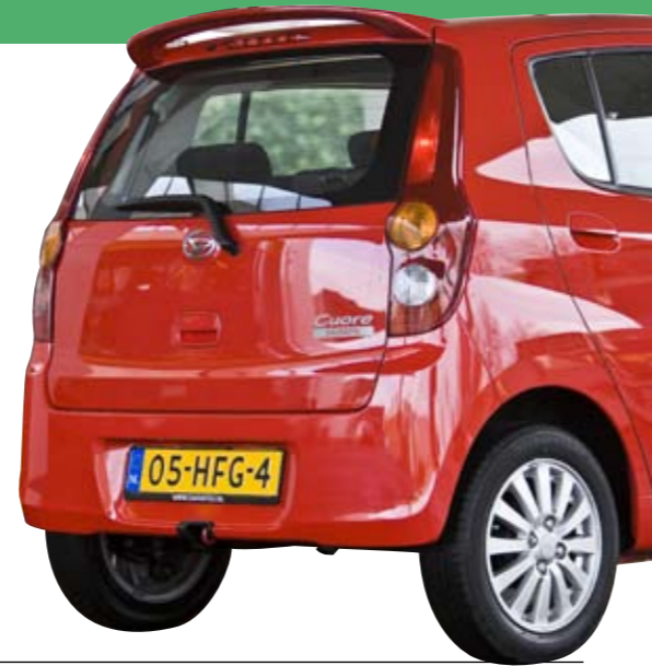
LISETTE DE GRAAF